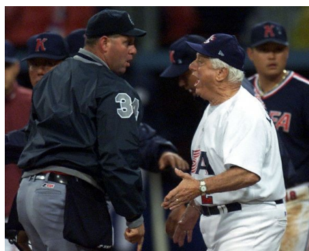
Le proteste sono sempre dietro l'angolo, come pure i protesti tecnici.

Quindi alla fine della fiaba non è cambiato nulla da quello che sapevamo ... o che credevamo di sapere ... ma abbiamo colto l'occasione per rafforzarci nei nostri convincimenti!