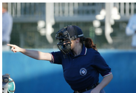
Come era diverso quando si andava solo in campo...